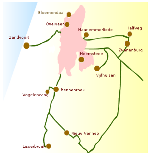
Fig. 1 Verzorgingsgebied Stichting de La Salle

Onze school, maakt samen met 18 andere basisscholen in de regio (zie afbeelding 1), deel uit van de 'Stichting Confessioneel onderwijs de la Salle'. In januari 2005 is de stichting opgericht uit een fusie tussen de Stichting Bijzonder Onderwijs Zuid-Kennemerland en de Stichting de Schakel (Haarlemmermeer). De la Salle heeft als uitgangspunt, dat ze ten aanzien van het personeel een sterke, efficiënte, resultaat-, maar vooral ook een persoonsgerichte en professionele organisatie wil zijn. Daarnaast wil ze een organisatie zijn, waarin de Raad van Toezicht, het College van Bestuur met het ondersteunende stafbureau, schooldirecteuren, onderwijspersoneel en Gemeenschappelijke Medezeggenschapsraad, allen vanuit hun eigen positie en verantwoordelijkheid, samenwerken aan de ontwikkeling en de kwaliteit van het onderwijs.